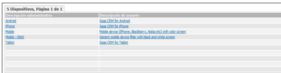
Lista de dispositivos