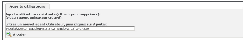
Champ Agent utilisateur