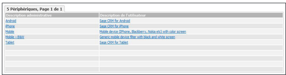
Liste des périphériques