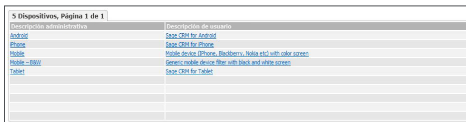
Lista de dispositivos